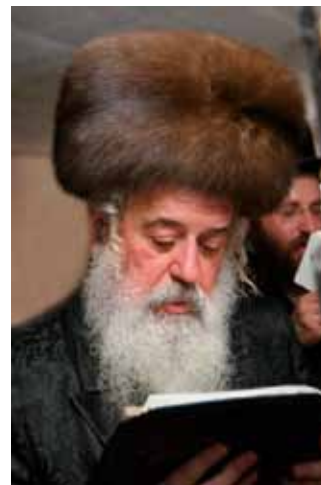
כובע קולפיק ובקישע פרחונית

וזו כבר נתקבלה (מיסודו של הר"א בן־יהודה). אבל באופן עמום וסמלי, אנו מוצאים אצל חז"ל את המלה "מזל", שאף־על־פי שיש לה הוראה אחרת המורה על השפעת המזלות; בצירוף זה דלקמן מרפרף הרעיון של דבר משהו מצליח, ולא נודע מדוע; דבר שהשעה משחקת לו, ויש לו שליטה אפילו על דברים שאין מהראוי וההגון שתהא לו נגיעה בהם [...] "מזל" זה הוא הוא – גלגל השינויים בנימוסם של בריות, שנראה כגורל, כמזל, משום שאיננו ברשותו של האדם היחיד [...] יש מצוות שזכו למזל, ויש שלא זכו. בשפתנו החדשה היינו אומרים: "יש שהן אפנה, ויש שאינן אפנה". צללי חולין עולים ובוקעים דרך סדקי ההיכל וכובשים את ספר־התורה; הידים הגסות, המשמשניות והעסקניות של מנהגיהם המקרי והנבוב, נועזות להגיה, להוסיף, לגרוע את האותיות המשוקדות, המתוייגות ומעוטרות, שיש בהן נצחיות. האפנה עושה את העיקר טפל, ואת הטפל עיקר; היא רואה את צל ההרים, ואת ההרים עצמם אינה רואה". הווה רץ לקלה כלחמורה; "האומר שמועה זו נאה ושמועה זו אינה נאה, הוא מאבד הונה של תורה" [...] כל המאמרים האלה, והרבה דוגמתם, הם תלונות כנגד באפנה, כשהיא חותרת להיכנס לקדשי־קדשים, לחטט ולנקר בהרוך והעדן של דברים נאצלים, ולפסוע על ראשי עם קודש בסנדלים המסומרים של גזורי גזירות, נימוסים ומנהיגים משתנים ככרום, ומתהפכים מן הקצה אל הקצה, אשר רוח־היום נושא אותם בכנפיהם. 13